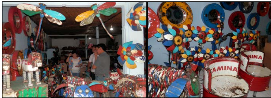
Gambar 4. Penataan Produk Mira Ferro Perkasa dan Budiana Art

Beberapa contoh produk Mira Ferro Perkasa dan Budiana Art yang sudah dipasarkan ke luar negeri dan pemberian peralatan kerja. Seperti Gambar 4 sebagai berikut.