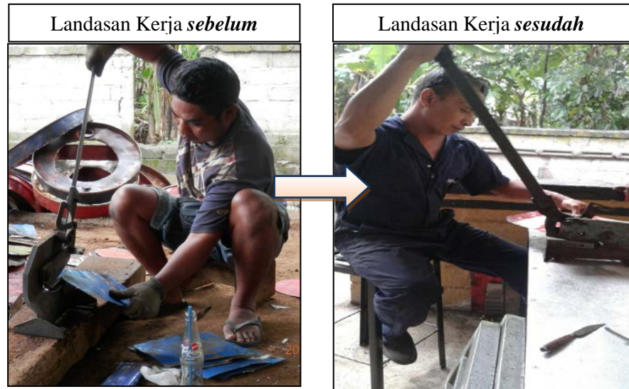
Gambar 3. Perbaikan Landasan Kerja Pemotongan Pelat.

Pola aliran Zig-Zag disebut pola aliran berbentuk ular dan sangat baik diterapkan bila aliran proses produksi lebih panjang daripada panjang area yang tersedia. Pola aliran demikian dapat mengatasi keterbatasan luas area serta bentuk dan ukuran bangunan usaha yang ada di Mira Ferro Perkasa dan Budiana Art. Perubahan landasan kerja pada proses pemotongan pelat yang lebih nyaman dan ergonomi seperti Gambar 3