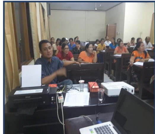
Pelatihan Pemasaran on line