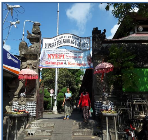
Gambar 4 Penjajagan Lokasi Pengabdian

Melakukan penjajagan untuk mengetahui kapan boleh dilakukan, siapa saja pesertanya, tempatnya dimana, kemudian panitia melakukan koordinasi dengan kepala pasar dan pedagang di Pasar Seni Guwang yang prosenya seperti gambar di bawah ini.