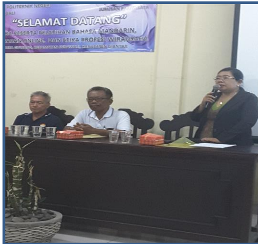
Gambar 5 Pembukaan Oleh Ibu Kapro UPW

Sebelum pelatihan bahasa Mandarin, diawali dengan pembukaan oleh ibu Kapro Usaha Perjalanan Wisata. Kemudian pelatihan bahasa Mandarin diberikan oleh guide bahasa Mandarin dari anggota HPI Bali selama dua hari dari tanggal 17 sampai 18 Mei 2017, di mana prosesnya seperti pada gambar di bawah ini.