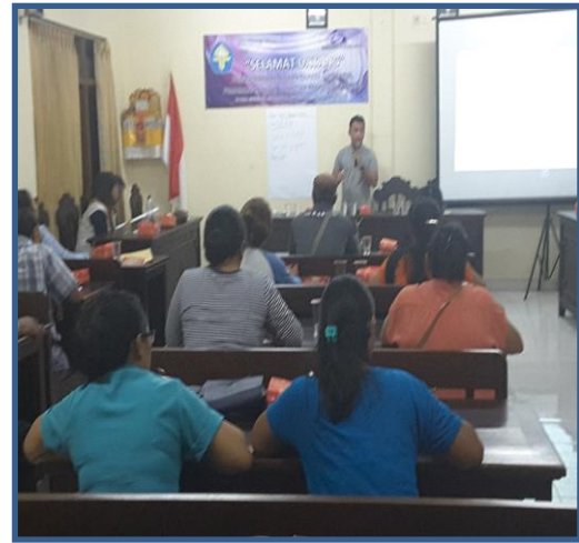
Pelatihan Bahasa Mandarin

Tujuan atau sasaran pelatihan bahasa Mandarin ini adalah untuk meningkatkan kemampuan para pedagang untuk berkomunikasi dalam bahasa Mandarin dengan wisatawan China secara efektif