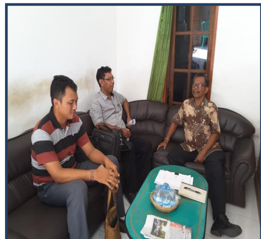
Koordinasi dengan Pengelola Pasar Seni