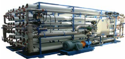
Gambar 1. Mesin Pemurnian Air Model RO

Sistem pemurnian air bertujuan untuk menghilangkan mineral – mineral yang tidak diinginkan dalam proses produksi uap di boiler. Ada beberapa sistem pemurnian air skala industri yang biasanya digunakan. Seperti demineralisasi (demin plant) dan Reverse Osmosis . Secara singkat proses