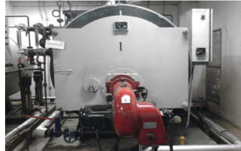
Gambar 2. Ketel Uap Hotel Conrad Bali

Ketel uap atau boiler merupakan bejana tertutup dimana panas pembakaran dialirkan ke air sampai terbentuk air panas atau uap atau berupa energi kerja. Berikut gambar dan spesifikasi ketel uap yang digunakan di Hotel Conrad Bali, seperti berikut: